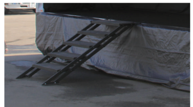
5段階・ステージスカート