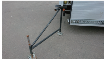
揺れ止め部材 (後部)