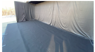
暗幕・パンチカーペット