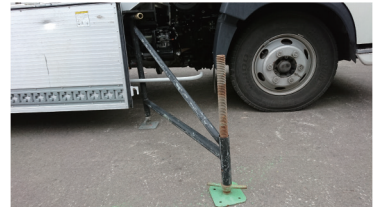
揺れ止め部材 (前部)