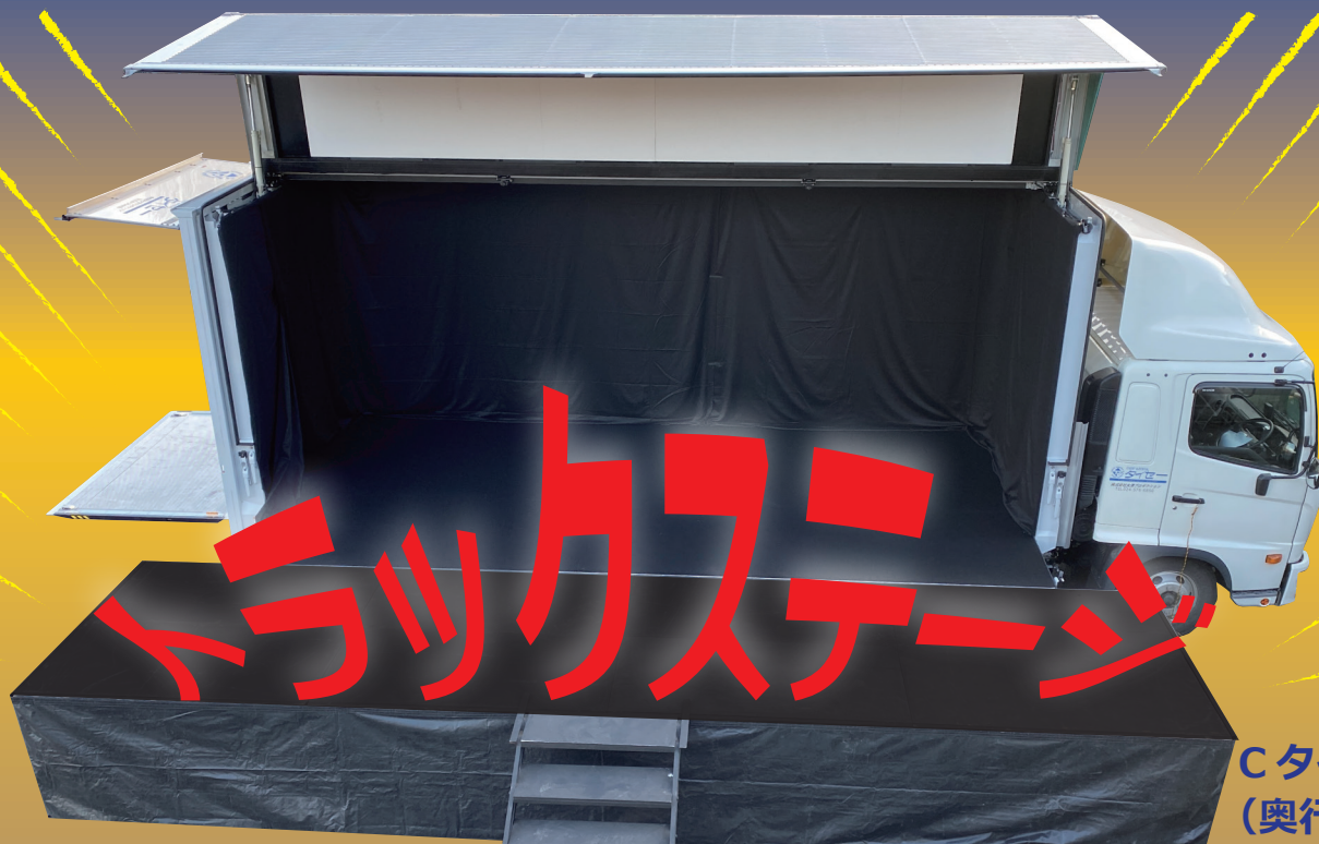
Cタイプ (奥行 5,000 mm)