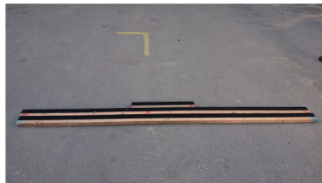
アオリ部ステージスカート支持部材