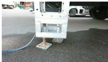
トラス・ジャッキベース